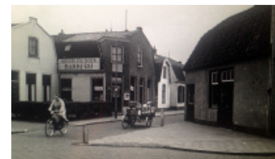
Kwakernaak, Leeuwenstraat hoek Kampstraat.

die mono platen bijna vijftig jaar na deze snode daad, weer terugvond: in de f. 0,50-bakken bij de Hilversumse kringloopwinkel. Daaronder zat een Supraphon-lp met De Gouden Haan van Rimsky Korsakof, een Decca-plaat met Petrouchka van Stravinsky en een Columbia-lp met de pianiste Moura Lympany in het 22' pianoconcert van Mozart.