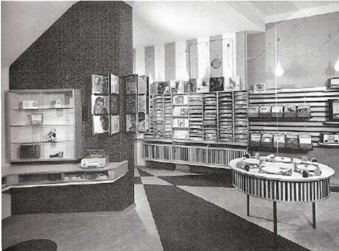
Een wel heel fraaie interieurfoto. Top fifties design. Let op de Triotrack grammofoons die zijn ingebouwd in de luistertafel. De foto is gemaakt in een platenzaak in Hilversum, de interieurarchitect is W. Bauer.

name, met ongekeerde montage- en effectmogelijkheden, geven veel opnamen van de laatste dertig jaar iets kunstmatigs mee, nog geaccentueerd door de doodstille en kil aandoende achtergrond. Maar of je dat de brenger van de boodschap kunt verwijten? Ik koester mijn langspeelplaten en geniet van mijn cd-collectie. Maar een romantische avond platen draaien bij de open haard is toch iets speciaals. Alleen al die pracht lp-hoezen. Daar kan dat glibberige cd-doesje niet tegenop, om maar te zwijgen over het cd-boekje dat haast niet uit het doesje is te peuteren.