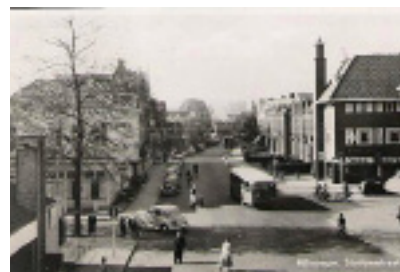
De Stationsstraat in 1952