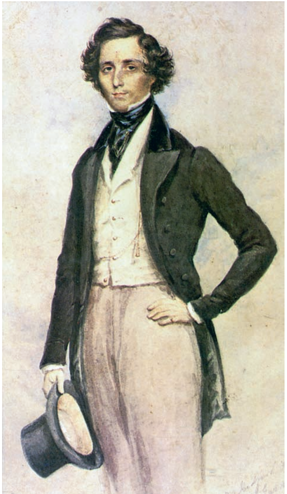
Felix Mendelssohn Bartholdy, aquarel door James Warren Childe, 1829.

Sonata VI geeft aanleiding tot verschillende interpretaties. In de melodie van het meditatieve laatste deel zien velen een verwantschap met de melodie die Edward Milne (1731-1804) componeerde bij de tekst van het passielied 'When I survey the wondrous Cross' van Isaac Watts. De melodie was overigens een bewerking van een reeds bestaande. Mendelssohn kan tekst en muziek tijdens zijn reizen naar Engeland gehoord hebben, al werd deze tekst vaak op andere melodieën gezongen. Er ontstaat dan een verbinding tussen Christus' Onze Vader-gebed – 'Vater unser im Himmelreich' is een lied van Luther bij het Onze Vader – en de kruisdood van Christus. Sommigen zien ook nog verwantschap tussen de pedaaltonen in de eerste variatie en de pedaalpartij van Bachs koraalvoorspel 'Durch Adams Fall ist ganz verderbt' BWV 637. In dat geval zou het Onze Vader in verband gebracht worden met Christus' kruisdood en de reden daartoe, de zondeval van Adam en Eva. Tekst en melodie van 'Vater unser im Himmelreich' zijn van Luther. Kern van diens theologie is de theologia crucis die stelt dat God zich openbaart in het tegendeel van Zijn heerlijkheid, in het bijzonder in Christus' lijden en kruisdood. 5 Mendelssohn zou in dat geval zijn cyclus besluiten met een verwijzing naar het