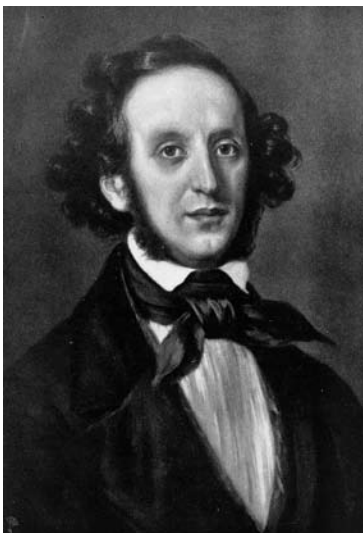
Felix Mendelssohn Bartholdy, geschilderd door Eduard Magnus.