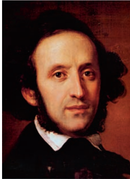
Portret door Eduard Magnus.

oratoria gaat over Paulus (die van een Joodse Saulus in een christelijke Paulus veranderde, JvdK) en zijn grootste oratorium gaat over Elias (de Joodse profeet bij uitstek, JvdK).” 8